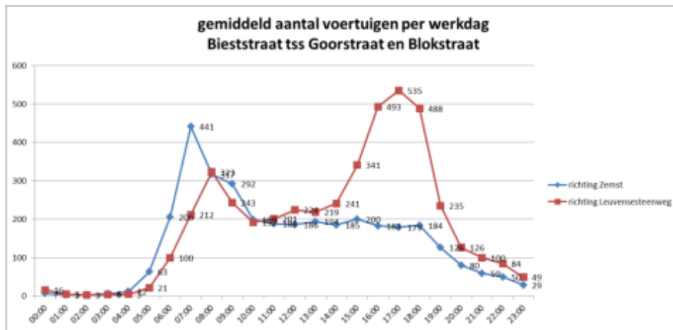
Figuur 51: Verkeersintensiteiten Bieststraat – 01/2020 2 (in pae/u)

niet significant afneemt. De recente verlaging van de snelheid op de Molenheidebaan kan ook negatief bijdragen aan de aantallen.